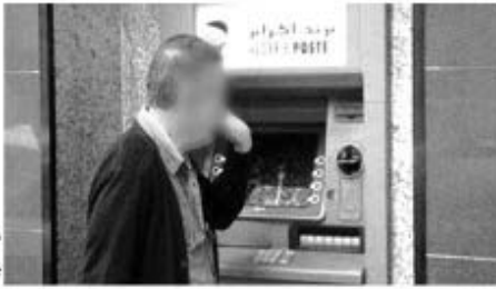
أدوار خدمات بريد الجزائر

البريدية بوسط المدينة تصرف في الآونة الأخيرة تدهورا بسبب تراجع الخدمات المقدمة وغياب الرقابة على الأعوان، حيث يتعمد الكثير منهم استغلال الزبائن وتلك بمغادرة أماكن عملهم لأسباب مجهولة، مما يؤثر سلبا واستثناك المواطنين وهو ما يقفنا عليه وشاهدناه يوم اعتناء تأهيلك عن القوضي ونقص الأعوان المؤهلين، وقد حاولنا طرح هذه الانتقادات على مسؤول الوكالة، غير أننا لم نتمكن من ذلك بسبب غياب هذا الأخير عن مقر عمله.