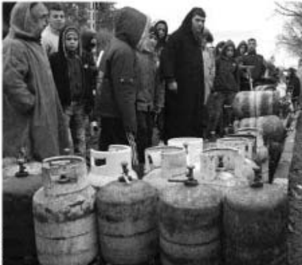
الحافلات من فورة قارورات الغاز بدأت مع أولى شحنات البرد