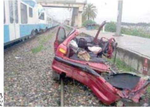
رجال الحماية المدنية انصرفوا إلى قطع هيكل السيارة لإخراج الجريح

لقي شخص مصرعه وأصيب آخر بجروح بليغة، أمس، إثر اصطدام قطار سريع كان قادما من الشلف باتجاه الجزائر العاصمة، بسيارتين على مستوى نقطة تلاقي السكة الحديدية مع الخطريق بمحطة بئر توتة في العاصمة.