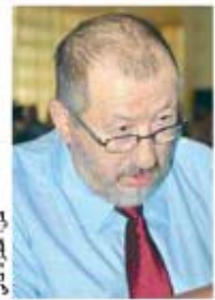
سيد السعيد سيدي

إدانت... غير أن سيدي السعيد يعسر على فرضهم على العمال. واتهم المعارضون، حسب بيان وزعمه على الصحافة، الأمانة الوطنية بالاعتداء بالقهر على القانون الأساسي والنظام الداخلي للمركزية النقابية، مشيرين إلى أن الوضع "السيئ" الذي تشهده المنطقة جراء التصرفات غير المسؤولة، حسب البيان، وغير الأخلاقية، لا يمكن أن يستمر خاصة مع استئصال الخروقات والتجاوزات. ومن جملة الخروقات التي أشارت إليها الوثيقة ذاتها، تجاوز العمدة القانونية لنشاط الأمانة الوطنية للاحاد وتهميش اللجنة التنفيذية وعدم عودتها لعقد دورتها العادية، حسب ما ينص عليه القانون، إضافة إلى تجديف موارد المنظمة كشره الدعم بحثا عن تزكية غير قانونية لعمدة جديدة وكذا التوقيفات التعسفية لإطارات النقابية. وحكّل أعضاء اللجنة التنفيذية المحتجون الأمانة الوطنية الحالية مسؤولية التراجع "للهريب" لمكانة الاتحاد وعدم تطلّع العمال في مسؤوليه، وهو ما يفسر الإعدارات والتوبيخات التي وجهت له من طرف الهيئات والمنظمات النقابية الدول.