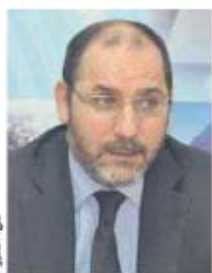
محمد الغزال مقري

فأجاب بأن "الاحتمالات كثيرة ومستعددة، وأفضلها هي الانتخابات المبكرة، من أجل بدء مسار سياسي جديد. ولكن إذا اشتدت الأزمة وتصلب النظام وصرار الحل هو حكومة توافقية للخروج من الأزمة، فسنبذل بذلك شرط أن تحقق الانتقال الديمقراطي". وأضاف: "لا زلنا نلاحظ أن الأزمة انهمأت والأسعار وسنكون موقفنا من الظروف".