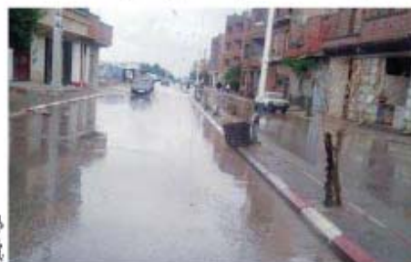
أعمال طرق وسط مدينة خنشة جوارها في صفاق

الجزائر أو المياه أو سونلغاز وغيرها، ثم تخصيص مبلغ مليار سنتيم لإخلاء الحفر الكبير. كما أكد ذات المتحدث أن البلدية عقدت اتفاقا مع أحد المقاولين الذي لم يتصله بعد المادة الأساسية للتزفيت من خارج الوطن، للشرع على الأقل في إخفاء هذه الشقوق السوداء، التي تم القيام بصيانة بعضها قبل سنة ليعود الشهور إليها من جديد.