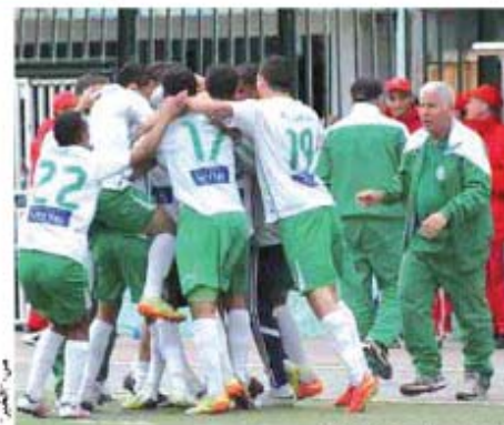
فرحة لاعبي البلدية تكررت هذا الموسم

وطالب الإدارة بفسخ عقده ومنعه وثاقته للالتحاق بفريق آخر وذلك