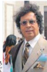
أحمد قذاف الدم

يرى أحمد قذاف الدم، متسق العلاقات الليبية المصرية سابقا، وابن عم الزعيم الليبي الراحل، معمر القذافي ومساعد السابق، في تصريح لـ "الخبر"، أنه لا يجازي لأي مبادرات حوار بين الفرقاء الليبيين داخل ليبيا، وشدد على ضرورة أن يتم الحوار بالجزائر، تحت رعاية أممية، كما حذر من "تسييس القوات المسلحة".