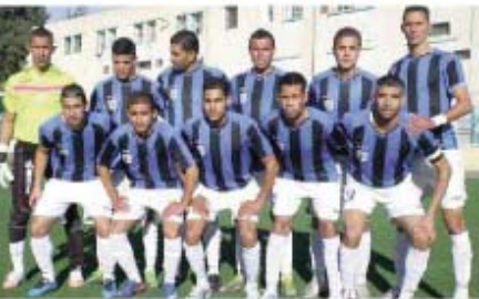
فريق نجم الياسير

تمكن، أول أمس، فريق نجم الياسير الممثل الوحيد لولاية برج بوعريش في منافسة كأس الجمهورية من تحقيق تأهل تاريخي إلى الدور ثمن النهائي على حساب الشيف تزامن وادي سوف من قسم الهواة، بثلاثية نظيفة في مباراة عرفت تألق أشبال المدرب الصادق مراكشي.