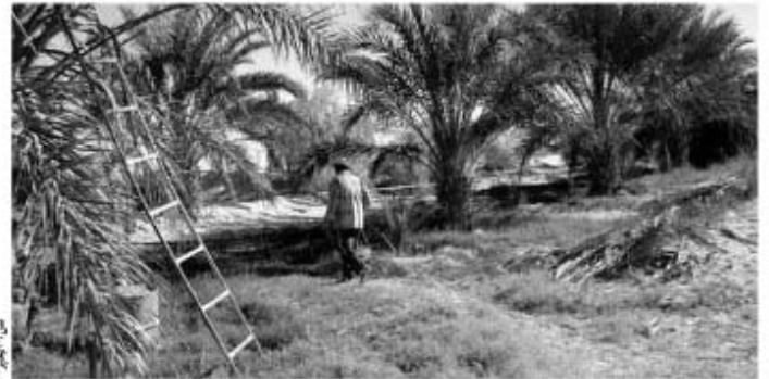
مزرعة بوادي سوط

ذكر العديد من الفلاحين بأن آلاف القوارض كبيرة الحجم الشبيهة بالطوبية تغزو منذ أيام المزارع الفلاحية في عدة مناطق فلاحية محدثة فيها فسادا وخرابا خاصة المزروعات تحت الأرض على غرار البطاطا.