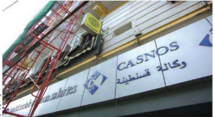
تجارتا المديرات الجهوية في ولاية قسنطينة، على اليمين

أجمع تجار ومدارس السيادة للولايات الشرقية، خلال عقد الندوة الجهوية الخامسة للاتحاد العام للتجار والجرهين بقسنطينة، أول أمس، على اصطدامهم بإشكالية تصديق من التعاقد لدى الصندوق الوطني للتأمين لغير الأجاء والإحد يد 65 سنة، وهو ما اعتبروه إجحافا في حقهم وعزوف الكثير منهم في الاشتراك بهذا الصندوق.