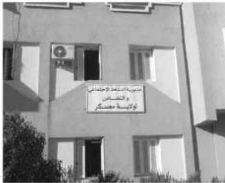
مديرية النشاط الاجتماعي في معسكر

حلت أمس لجنة تفتيش من وزارة التضامن، تتكون من ثلاثة إدارات مركزية مختصين في التخطيط والميزانية ومهندس في الإعلام الاتي، بمديرية النشاط الاجتماعي بمعسكر، حيث ستلقي اللجنة بإطارات هذا السلك الإحساس ومديري المراكز لحصر مختلف النقائص التي يعاني منها القطاع.