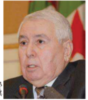
عبد القادر بن صالح

● قالت مصادر متابعة للشأن السياسي في ولاية إليزي، إن "تسونامي" ضرب التجمع الوطني الوطني الديمقراطي، وذلك عقب إعلان عدد كبير من مناضلي حزب بن صالح، منهم منتخبون محليون ووطنيون وأطارات الحزب، استقالتهم الجماعة من الأرندي، وذلك في سياق سياسة الغضب التي تلاحق قيادة الحزب في إطار عمليات تجديد الهياكل التي أقرتها قيادة الأرندي، ولقيت معارضة شديدة في القواعد. فهل يتحرك بن صالح لإنقاذ حزبه في إليزي؟