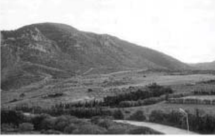
المستثمرات الثلاثة بولاية جرجرة كرمواوي الطيب

مؤكد أن الوعود ذهبت أدراج الرياح، وبعد مدة من الانتظار جاء شخص يذهب بملكيته لذات الأرض وطهره منها في حضور محضر قضائي وذلك بعدما تحصل على حكم قضائي لفائدته بفضل التسوية التي أجرتها له المصالح الفلاحية التي قال عنها أنها خدلتها وهي التي تعلم ما يناله من جهد من أجل تحويل أرض صخرية إلى مستثمرة منتجة.