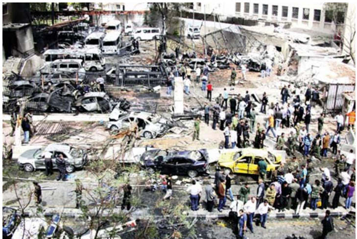
အဆောက်အအုံအပျက်များကြား ရောက်ရှိနေသည့် ဆီးရီးယားပြည်သူများကို တွေ့ရစဉ်။

ပဋိပက္ခတွင် ပါဝင်ကြသူအားလုံး အနေဖြင့် လူသားချင်းစာနာမှု အကူအညီများ အကန့်အသတ်မဲ့ပေးအပ်ခွင့် ပြုပေးသင့်ကြောင်း ဖေဖော်ဝါရီလအတွင်းက အတည်ပြုချမှတ်ခဲ့သော ကုလသမဂ္ဂ ဆုံးဖြတ်ချက်တစ်ရပ်တွင် တိုက်တွန်းထားသည်။ ဆီးရီးယား၏ သုံးနှစ်ကြာ ပြည်တွင်းစစ်ကြောင့် လူပေါင်း ၁၅၀,၀၀၀ ကျော် သေဆုံးခဲ့ရကြောင်း ခန့်မှန်းထားကြသည်။