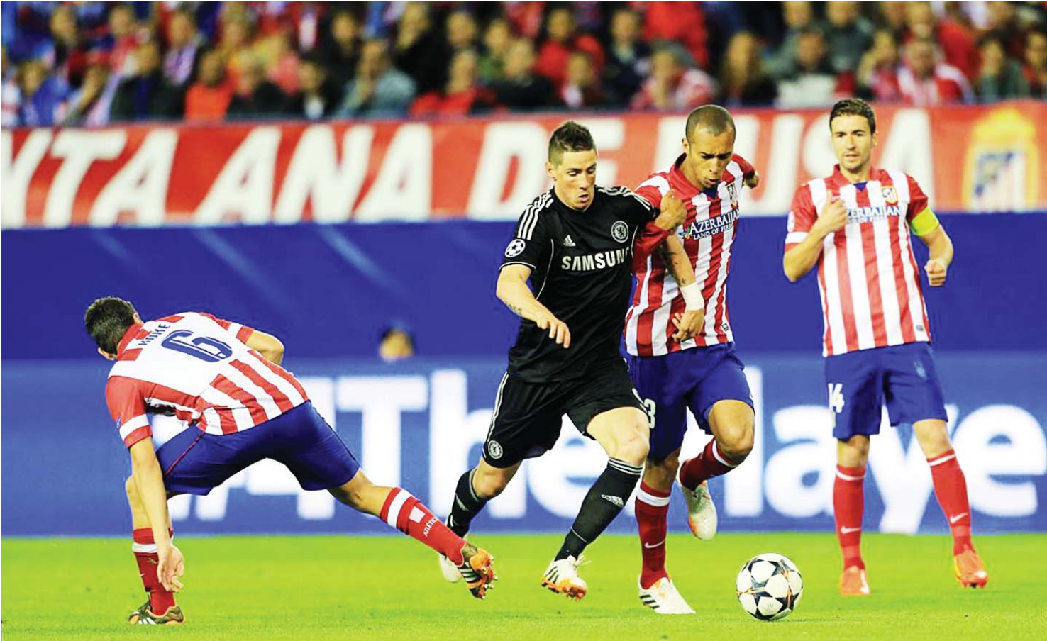
အက်သလက်တိကို ကွင်းတွင်ကစားခဲ့သည့် ဂိုးမရှိသရေကျခဲ့သော ပထမအကျော့ပွဲစဉ်မှ မြင်ကွင်းတစ်ခု။

ထူးခြားမှုများ ➢ အက်သလက်တိကိုအသင်းဟာ အင်္ဂလန်အသင်းတွေနဲ့ အဝေးကွင်းပွဲစဉ် အဖြစ် ကိုးပွဲကစားထားရာမှာ တစ်ကြိမ်သာ အနိုင်ရထားဖူးပြီး လေးပွဲရှုံး လေးပွဲသရေ ရလဒ် ထွက်ပေါ်ထားပါတယ်။ ➢ ချယ်လ်ဆီးအသင်းနည်းပြ မော်ရင်ဟိုဟာ နီးယဲလ်အသင်းကို ကိုင်တွယ်ခဲ့စဉ်