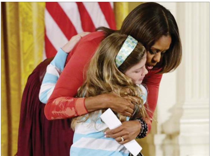
အမေရိကန်သမ္မတကတော်နှင့် ရှာလော့ဘဲလ်တို့ကို တွေ့ရစဉ်။ (ဓာတ်ပုံ-တယ်လီဂရပ်)

မိသားစု၏ စိတ်ပျက်စရာ အခြေအနေကိုလည်း ပြောကြားခဲ့သည်။ ခင်ပွန်းဖြစ်သူ သမ္မတ အိုဘားမား အာရှသို့ ခရီးသွားနေစဉ် အဆိုပါအထိမ်းအမှတ်ပွဲကို သဘာပတိအဖြစ် ဆောင်ရွက်သော မီချယ်အိုဘားမားမှ ထိုစီဗီကို ရရှိခဲ့ပြီး မိုက်ကရိုဖုန်း အသံမဝင်သည့်နေရာတွင် ကလေးငယ်အား အသံဖြည့်ညှင်းစွာ အားပေးစကား ပြောကြားခဲ့သည်။ ထို့နောက် မစ်ရှင်အိုဘားမားက ကလေးငယ်အား ပွေ့ဖက်ခဲ့သည့်အတွက် တက်ရောက်လာသော ပရိသတ်အချို့မှာ အံ့အားသင့်ခဲ့ရသည်။ “ယင်းကိစ္စရပ်သည် ကိုယ်ရေးကိုယ်တာ ပြဿနာတစ်ရပ်ဖြစ်ပြီး သူမ၏ ဖခင်အတွက် သူမက တစ်ခုခုလုပ်ပေးခြင်း ဖြစ်ကြောင်း” မစ်ရှင်အိုဘားမားက ပြောကြားသည်။ ■