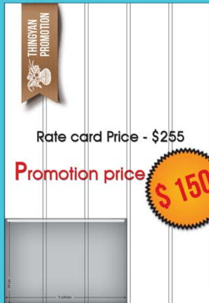
10 by 3 ( 10 cm x 3 col )