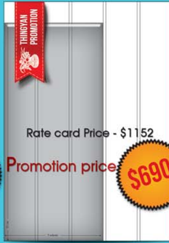
Vertical ( 32 cm x 3 col )