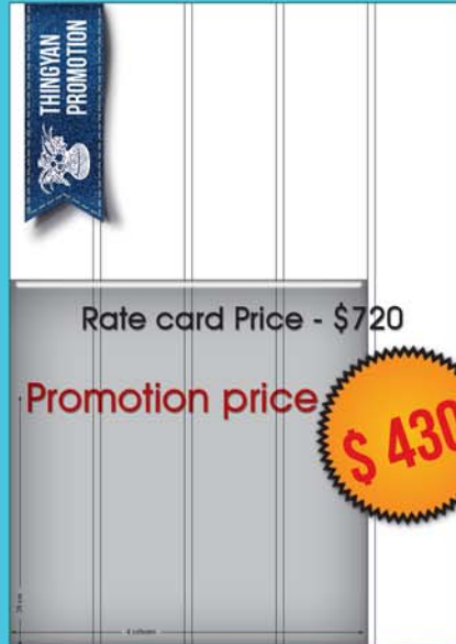
20 by 4 ( 20 cm x 4 col )