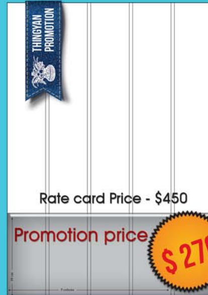
10 by 5 ( 10 cm x 5 col )