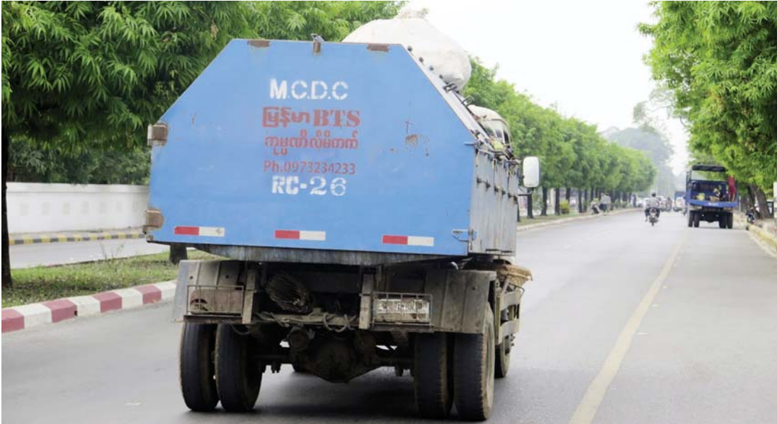
စည်ပင်သာယာဝန်ထမ်းများ ကျိုးဘေးတွင် သန့်ရှင်းရေးပြုလုပ်စဉ် စည်ပင်သာယာအမှိုက်သိမ်းကားကို တွေ့ရစဉ်။