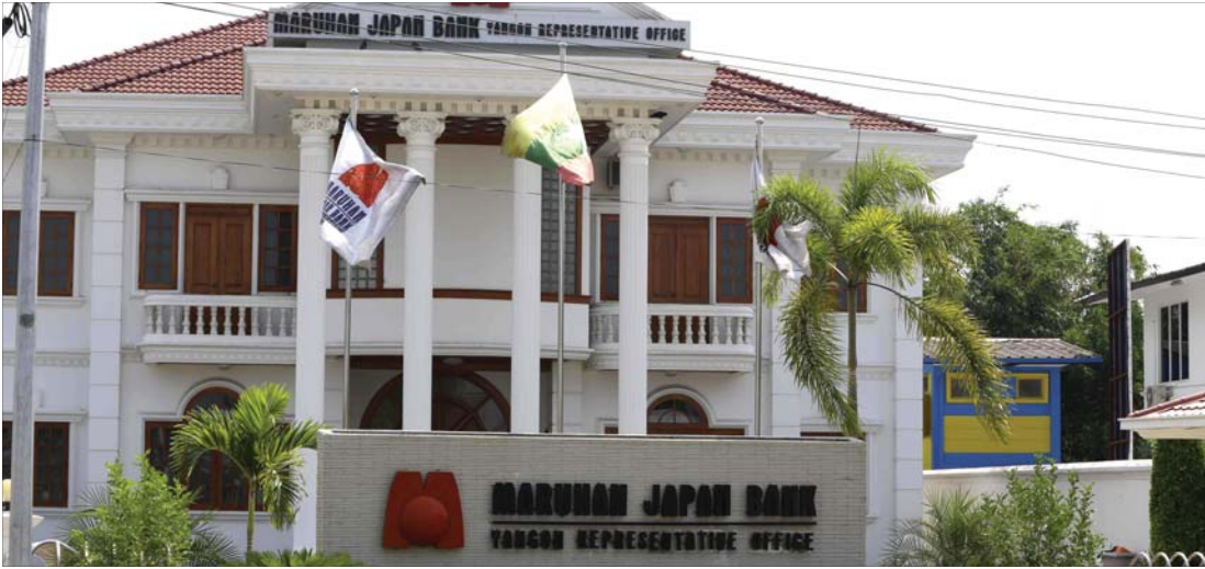
ကန့်သတ်ချက်များဖြင့် ဖွင့်လှစ်ခွင့်ပြုပါက ပြည်တွင်းဘဏ်များကို ထိခိုက်နိုင်မည်မဟုတ်ဟု ဆိုသည်။

ဗဟိုဘဏ် ဒုတိယဥက္ကဋ္ဌ ဦးဆက်အောင်က “ နိုင်ငံခြားဘဏ်တွေကို ဖွင့်ခွင့်ပေးလိုက်မယ်ဆိုရင် မြန်မာနိုင်ငံရဲ့စီးပွားရေးဖွံ့ဖြိုးမှုနှုန်းဟာ ထင်ထားတာထက်အများကြီးမြန်သွားမှာဖြစ်ပါတယ်။ ကန့်သတ်ချက်တွေနဲ့ ခွင့်ပြုလိုက်ရင် ပြည်တွင်းဘဏ်တွေလဲထိခိုက်မှုမရှိဘူး။ နိုင်ငံခြားဘဏ်တွေကလဲကျေနပ်တယ်။ နိုင်ငံရဲ့ financial centre (ငွေရေး ကြေးရေးကဏ္ဍ)က လဲတိုးတက်မှုအများကြီးဖြစ်လာမဲ့အတွက်