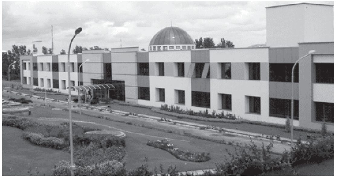
အိန္ဒိယနည်းပညာတက္ကသိုလ် Bengaluru India Institute of technology ကို တွေ့ရစဉ်။

ထို့ပြင် မန္တလေးမြို့ ရတနာပုံတွင် ဖွင့်လှစ်မည့် Myanmar Institute of Information Technology (MIIC) ကျောင်းကိုလည်း အိန္ဒိယနည်းပညာတက္ကသိုလ်မှူးဖြင့် ပူးပေါင်းဖွင့်လှစ်သွားရန် ဆောင်ရွက်လျက် ရှိနေပြီဖြစ်ကြောင်း ဦးကျော်စွာစိုးထံမှ သိရသည်။