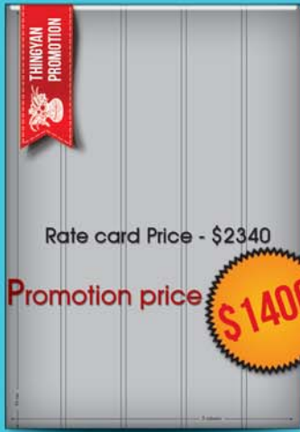
Full Page (35cm x 5col)