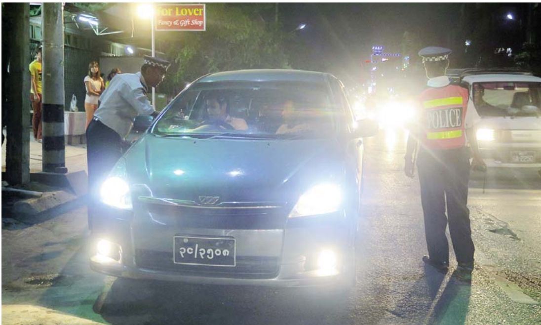
ညပိုင်းတွင် ယာဉ်စစ်ဆေးမှုများ ပြုလုပ်နေစဉ်။ နောက်သုံးလေးလအတွင်း လိုင်စင်မဲ့ယာဉ် ၁၁ စီး ဖမ်းဆီးနိုင်ခဲ့သည်။

စည်းကမ်းပျက်ယာဉ်များ ညပိုင်းစစ်ဆေးအရေးယူခြင်းကို မတ်လ ၂၃ ရက်က