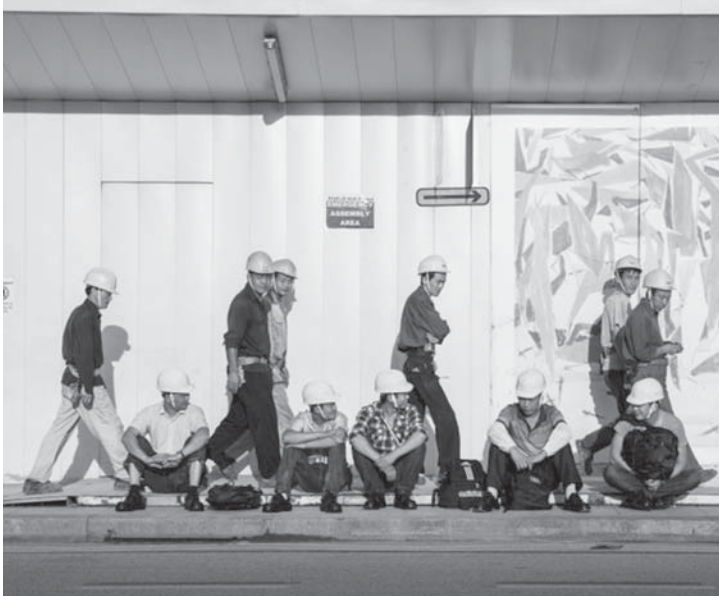
စင်ကာပူနိုင်ငံတွင်အလုပ်သမား လူတန်းစားများမှာ အသက်အရွယ်ကြီးမြင့်နေကြသည်။

အလုပ်ရှင်များဘက်မှ အလုပ်သမားတိုင်းကို မှန်မှန်ကန်ကန်အသုံးပြုနိုင်ရန် လေ့လာသင်ယူ၍ အလုပ်သမားတိုင်းကို ကောင်းမွန်စွာထိတွေ့ ဆက်ဆံရမည်ဟု ဆိုသည်။ ဆက်လက်၍ ၎င်းက ထူးချွန်ကောင်းမွန်သောအလုပ်ရှင်များသာလျှင် ထူးချွန်၍ အရည်အသွေး ရှိသောအလုပ်သမားများကို ဆွဲဆောင်သိမ်းသွင်း၍ ၎င်းတို့၏လုပ်ငန်းများတွင် အကျိုးအမြတ်ကောင်းများရရှိအောင်ဆောင်ရွက်နိုင်သည်ဟုပြောသည်။