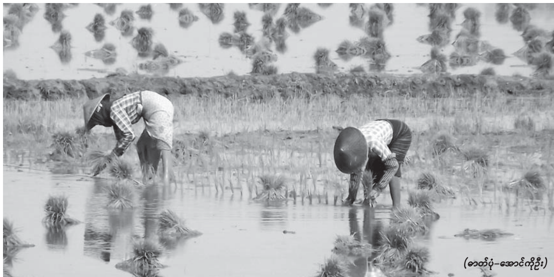
မန္တလေးတိုင်း၊ ပြင်ဦးလွင်ခရိုင် မတ္တရာမြို့နယ်အတွင်း ထွန်တုံးတိုက်ပွဲဆင်နွှဲနေသည့် လယ်မြေများတွင် စပါးစိုက်ပျိုးနေစဉ်။