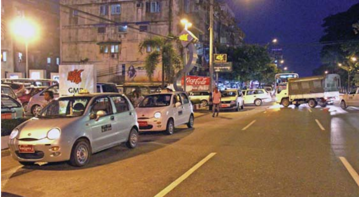
ရန်ကုန်မြို့တွင်း တစ်နေရာတွင် စည်းကမ်းမဲ့ ရပ်နားထားသည့် အငှားယာဉ်များကို တွေ့ရစဉ်။

ရခိုင်အမျိုးသားညီလာခံမှတစ်ဆင့် တည်ငြိမ်းအေးချမ်းရေးအတွက် ဥပဒေမဇ္ဈိမကို ပြောထားသေးသည်။ ■