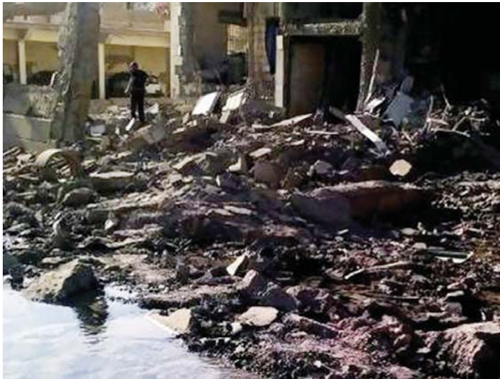
ကာဒစ်ရှီမြို့ ဗုံးခွဲတိုက်ခိုက်မှုအပြီး မြင်ကွင်း။

နိုင်ငံအတွင်း၌ အကြမ်းဖက်မှုများနှင့် အကြောက်တရားများ တိုးပွားလာနေသည့်