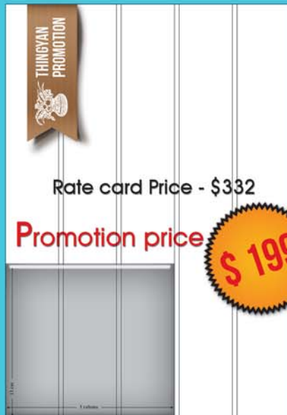
13 by 3 ( 13 cm x 3 col )