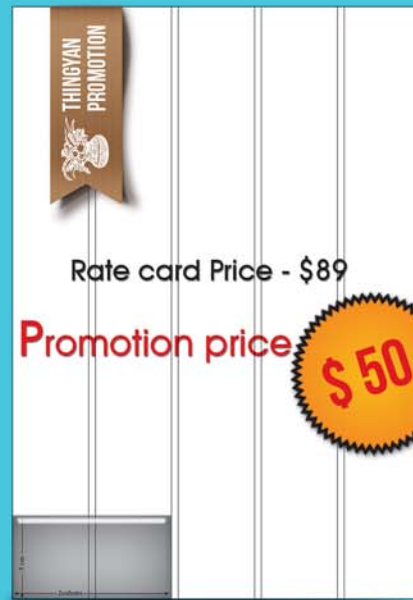
5 by 2 ( 5 cm x 2 col )