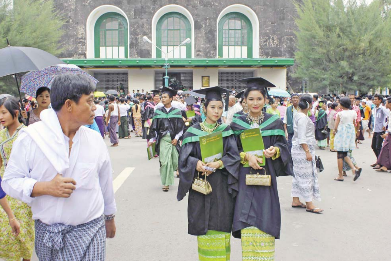
ရန်ကုန်တက္ကသိုလ်မှ မွေးထုတ်ပေးလိုက်သည့် ဘွဲ့ရမောင်မယ်များကို တွေ့ရစဉ်။ (ဓာတ်ပုံ-မဇ္ဈိမ)

ပညာရေးဝန်ကြီးဌာနမှ ရေးဆွဲထားသည့် ပညာရေးသင်ရည်စဉ်ဒေသ မူကြမ်းပါ ပြဋ္ဌာန်းချက်များသည် ကျောင်းသားများ ပညာသင်ကြားခွင့်ကို မိန့်ဝံ့ထားသည့် ဥပ