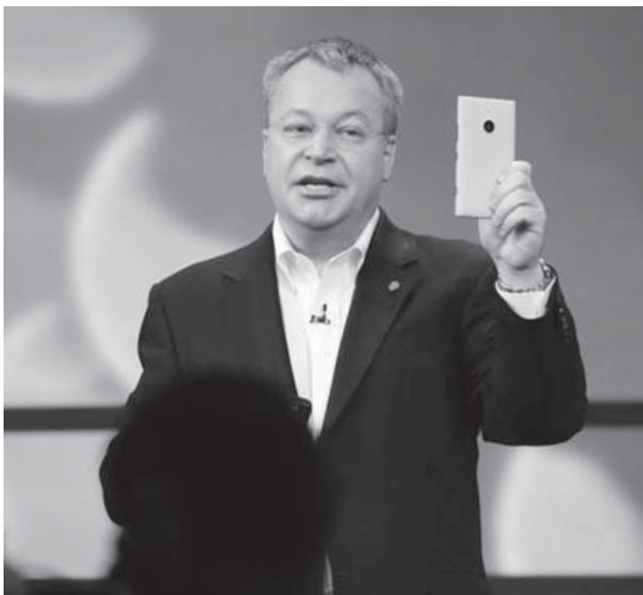
Nokia ၏ CEO ဖြစ်သူ Stephen Elop က Nokia ဖုန်းများများ၏ အနာဂတ်နှင့်ပတ်သက်ပြီး ပြောကြားနေစဉ်။

Elop နှင့် အမေးအဖြေကဏ္ဍတွင် Elop မှ ကုမ္ပဏီ၏ ကုန်ပစ္စည်းအမှတ်တံဆိပ် အသစ်ဖြင့် ရှေ့ဆက်မည့် လုပ်ငန်းစဉ် အသေးစိတ်ကို ပြောကြားရန်ငြင်းဆန်ခဲ့သည်။ ထို့နောက် Elop မှာ လက်ရှိအချိန်တွင်