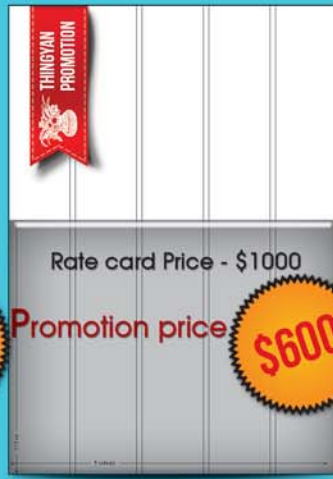
Half Page ( 17.5 cm x 5col )