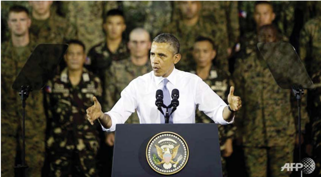
အမေရိကန်သမ္မတ ဘားရက် အိုဘားမား အာရှခရီးစဉ်အတွင်း အမေရိကန်နှင့် ဖိလစ်ပိုင်တပ်ဖွဲ့များသို့ မနီလာမြို့တွင် အင်္ဂါနေ့က မိန့်ခွန်းပြောကြားနေစဉ်။

ပိုင်နက် အငြင်းပွားမှုတွင် တရုတ်နိုင်ငံသည် တောင်တရုတ်ပင်လယ်အတွင်းရှိ