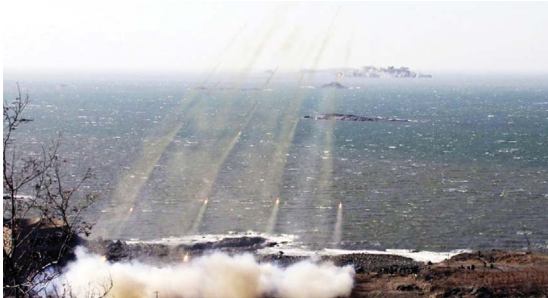
တောင်နှင့်မြောက်ကိုရီးယားအကြား ရေပိုင်နက်အငြင်းပွားနေသည့်နေရာအနီး၌ လက်နက်ကြီးများပစ်ခတ်နေစဉ်။

အဆိုပါသတင်းကြောင့် စစ်ရေးလေ့ကျင့်မည့်နေရာအနီးရှိ ငါးဖမ်းသမားများအား