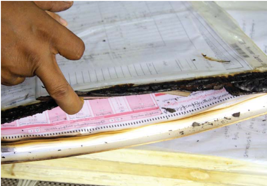
ဧပြီ ၂၈ရက်က တောင်ကြီးမြို့အတက်လမ်းတွင် မီးလောင်ခဲ့သည့် ကားပေါ်တွင်ပါရှိသော နောင်တရားမြို့နယ်မှ ကောက်ယူထားသော သန်းခေါင်စာရင်းစာရွက်များကို အသစ်ပြန်လည်ကူးယူနေစဉ်။

တွယ်ဆောင်ရွက်ရမှာ ကြန့်ကြာမှုတွေဖြစ်နေတယ်။ အငြင်းပွားအမှုတွေဆို အချိန်ကာတော့ ဘယ်သူက လုပ်ရမှန်းမသိ ဖြစ်နေတယ်။ မြေယာပြဿနာတွေမှာ အုပ်ချုပ်ရေးဘက်လိုက်ဆောင်ရွက်တာတွေလည်းရှိတော့အခု ပြည်သူတွေက ကော်မတီကို တိုင်ကြားတာ၊ ကော်မတီက စုံစမ်းပြီး လွှတ်တော်ကို တင်ပြပေးမယ်။ ဖြေရှင်းဆောင်ရွက်ပေးရမှာတော့ အစိုးရပဲဖြစ်တယ်။အစိုးရတိုင်လို့ ကြာနေတယ်။ မထူးလို့ ကော်မတီဆီ ဆက်ပို့တာပါ။ ကော်မတီဆီရောက်တဲ့ တိုင်ကြားစာတွေက သက်ဆိုင်ရာတွေ တိုင်ကြားပြီးသား တွေတော့များတယ်”ဟု ဦးဇော်ဝင်းက မှတ်ချက်ပြုထားသည်။ ဧရာဝတီတိုင်းတွင် ကော်မတီ ၁၃ ခုရှိပြီး၊ ပြည်သူလူထု၏ တိုင်ကြားစာနှင့်အသနားခံစာ ဆိုင်ရာ ကော်မတီအား ၂၀၁၃ ဇန်နဝါရီလတွင် လွှတ်တော်တွင် ဖွဲ့စည်းခဲ့သည်။ ■