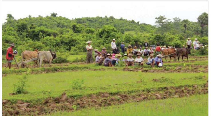
တပ်သိမ်းမြေများပြန်ရရေး ဧရာဝတီတိုင်း၊ အင်္ဂပူမြို့နယ်အတွင်း ထွန်တုံးတိုက်ပွဲ ဆင်နွှဲသည်ကို ၂၀၁၃ခုနှစ် နှောင်းပိုင်းက တွေ့ရစဉ်။