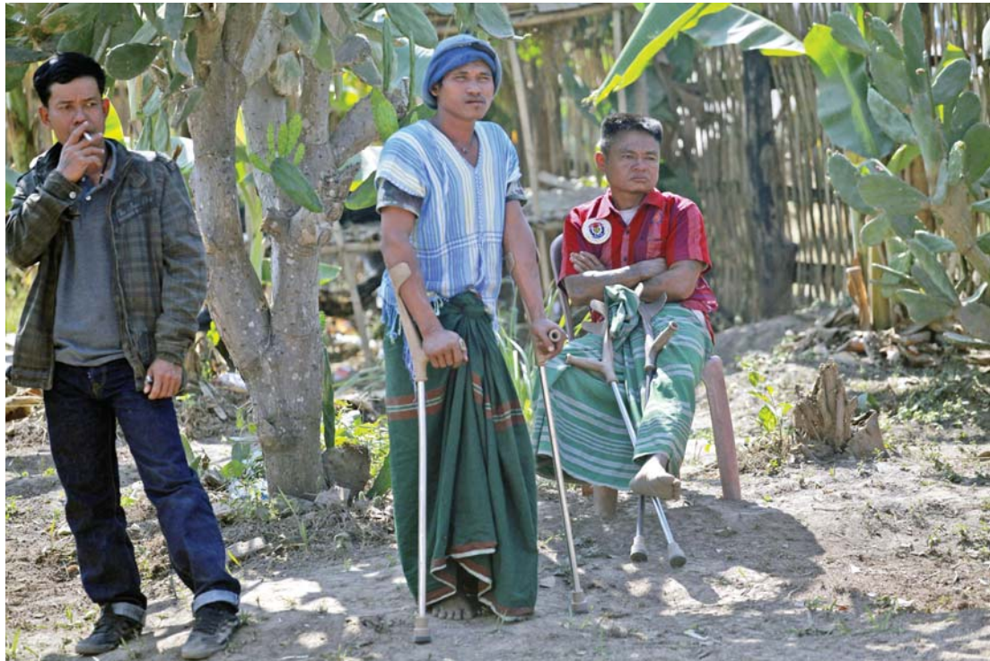
DKBA စစ်မှုထမ်းဟောင်းများကို ကရင်ပြည်နယ် ဆုံဆည်းမြိုင်ကျေးရွာ၌ ၂၀၁၃ ခုနှစ်၊ ဒီဇင်ဘာ ၂၁ ရက်က တွေ့ရစဉ်။

ကျေးရွာမှာ ဒုက္ခိတနဲ့ မုဆိုးမတွေရဲ့ မိသားစုပဲ ရှိတာပါ။ အဓိကအသက်မွေး ဝမ်းကျောင်း မရှိပါဘူး။ ထောက်ပံ့ပစ္စည်း တွေကိုပဲ အဓိကအားထားနေရတာပါ” ဟု