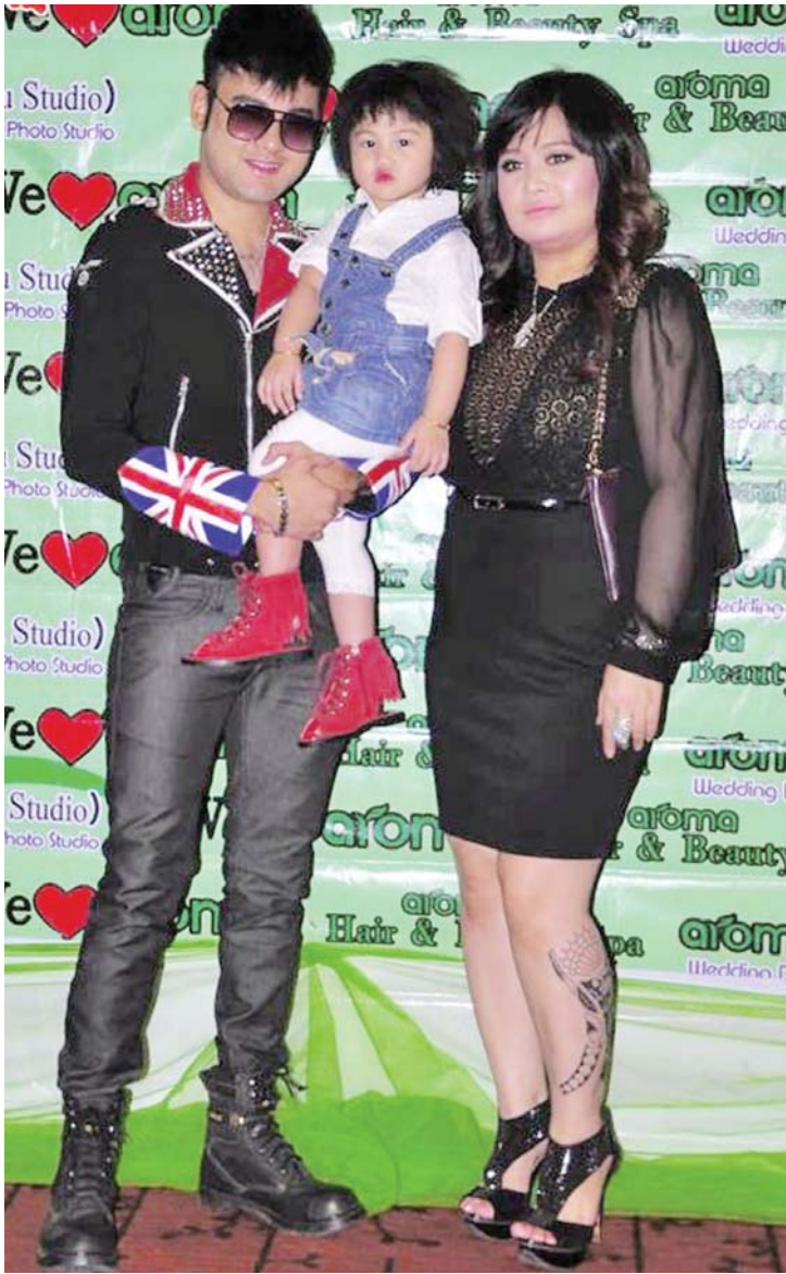
အကယ်ဒမီ ထက်ထက်မိုးဦး၊ ဇူးမြတ်ထက်နှင့် သမီးစစ်လွန်းဝတီထက်တို့ကို တွေ့ရစဉ်။

ထက်ထက်မိုးဦးသည် အချစ်လေး၊ ရွှေစင်ရွှေဆိုင်း၊ ဝတ်မောနင်းပေါင်မုန့်ကြော်ငြာများအပြင် ရုပ်ရှင်၊ ဗီဒီယိုဇာတ်ကားများစွာဖြင့် အောင်မြင်ခဲ့သူဖြစ်သည်။ ■