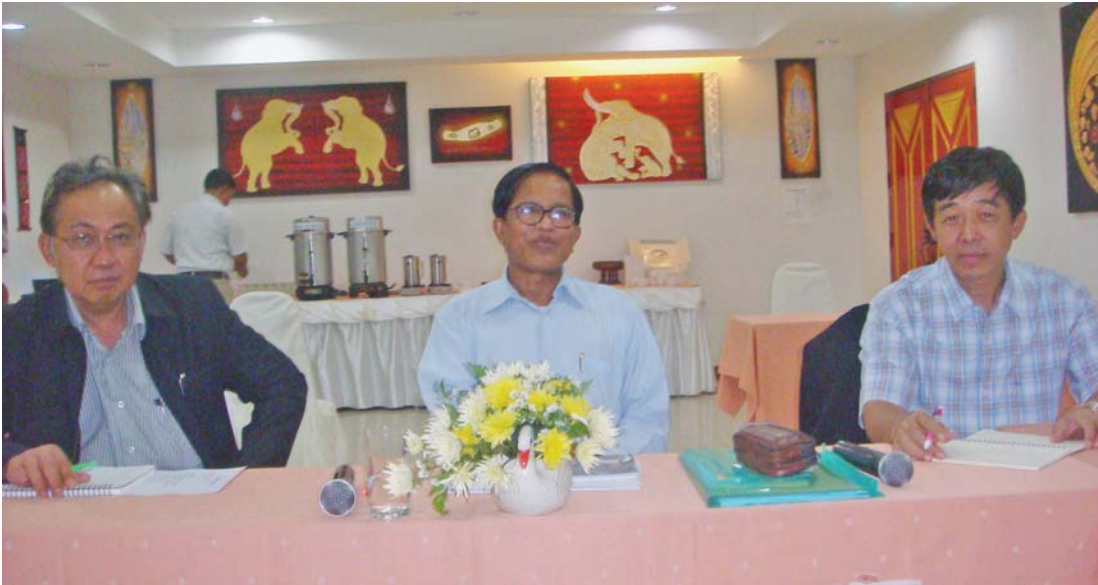
တိုင်းနိုင်ငံ၊ ချင်းမိုင်မြို့တွင် NCCT အဖွဲ့ဝင်များ အစည်းအဝေးပြုလုပ်ခဲ့ပြီး အစိုးရနှင့် ကချင်လွတ်မြောက်ရေးအဖွဲ့တို့ တိုက်ပွဲဖြစ်ပွားခဲ့ခြင်းအတွက် မေလ ၁၀ ရက်တွင် ဆွေးနွေးနိုင်ရန် အစိုးရကိုယ်စားလှယ်များထံ စာရေးသားပို့လိုက်သည်။ ဗန်ဒါ-ဗန်ဒါ

ဆွေးနွေးပွဲသို့ ကုလသမဂ္ဂ မြန်မာနိုင်ငံဆိုင်ရာ အထူးကိုယ်စားလှယ် မစ္စတာဝီဂျေး နမ်ဗီယား၊ တရုတ်ပြည်သူ့သမ္မတနိုင်ငံမှ Mr Wang Yingfan၊ ညီညွတ်သောတိုင်းရင်းသားလူမျိုးများဖက်ဒရယ်ကောင်စီ (UNFC) နှင့် တစ်နိုင်ငံလုံး အပစ်အခတ်ရပ်စဲရေးဆိုင်ရာညှိနှိုင်းရေးအဖွဲ့ (NCCT) ခေါင်းဆောင်များကိုလည်း ဖိတ်ကြားသွားမည်။