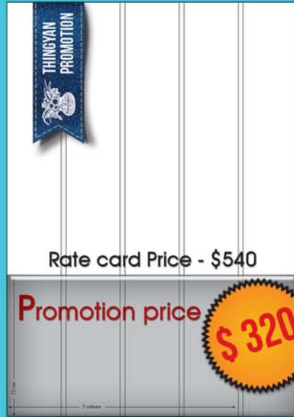
12 by 5 ( 12 cm x 5 col )