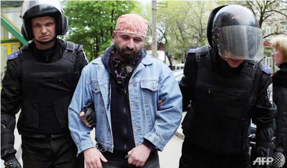
ယူကရိန်းနိုင်ငံ အရှေ့ပိုင်းတွင် ရုရှထောက်ခံသူတစ်ဦးကို ဖမ်းဆီးလာသည်ကို တွေ့ရစဉ်။

စပိန်ဟိုတယ်တွင် စားသုံးရန် ကန်ဒေါလာ ၂၀၀၀ ကုန်ကျမည် ကမ္ဘာ့နာမည်ကြီး စားဖို့ဖူးတစ်ဦး ဖြစ်သူ ပါကိုရှန်ဆာရိုမှ မကြာမီတွင် စပိန်နိုင်ငံ အီဘီဇာမြို့တော်ရှိ ဟာဒိုရောဟိုတယ်တွင် ဆပ်ဘာလီမိုးရှင်း အမည်ရ စားသောက်ဆိုင် တစ်ဆိုင်ကို ဖွင့်လှစ်သွားမည်ဖြစ်ကာ လာရောက်သုံးဆောင်ကြသူများအနေဖြင့် တစ်ဦးလျှင် ကန်ဒေါလာ ၂၀၀၀ ကျသင့်မည် ဖြစ်ကြောင်း ဧပြီ ၂၈ ရက်က ရာဟူး သတင်းတစ်ရပ်တွင် ဖော်ပြထားသည်။