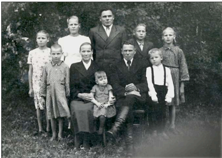
Наша дружная большая семья (не все ещё в сборе). 1953 г.

Из бересты делали вёдра — так называемые бурáки с деревянным дном и крышкой. В них носили воду.