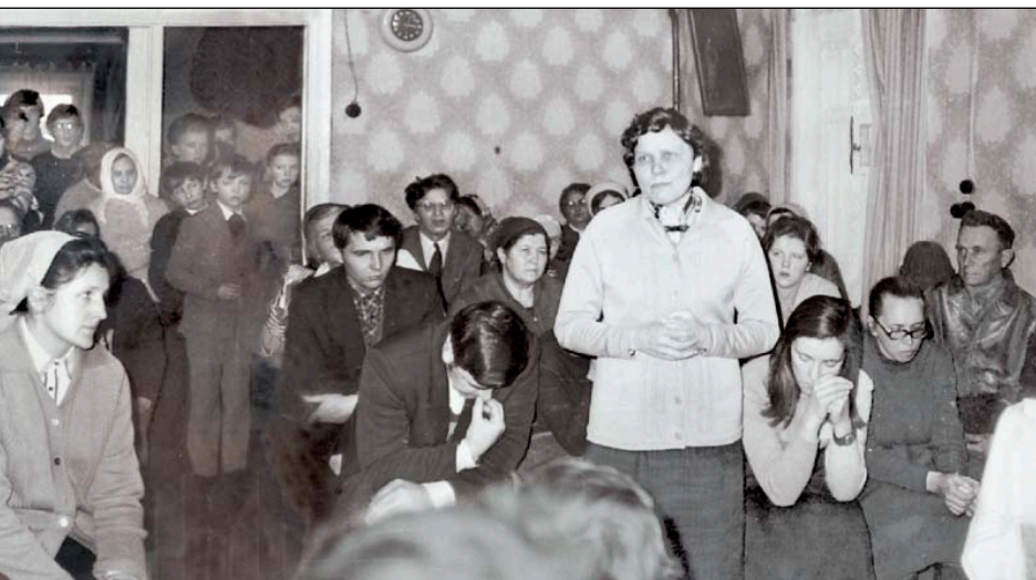
из уз в Ленинградской церкви. 1983 г.

о времени. Нас даже искали: «Так вот они где! Давно работать пора!»