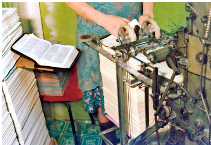
Самый надёжный самонаклад — ручной! Лист подать нужно меньше, чем за секунду

Самонаклад так и оставался самым узким местом в наших двухсторонних печатных машинах. Мы же покупали не спецбумагу в рулонах, где о ярлыках речи нет, а обыкновенный ширпотреб, который продавали в канцелярских магазинах в основном по одной пачке в руки. В такие пачки непременно вкладывали ярлык (бумажный квадратик размером 4х5 см), где указывался номер упаковщика. Перед началом работы каждую пачку бумаги пролистывали с двух концов, чтобы удалить вкладыши, мусор, повреждённые