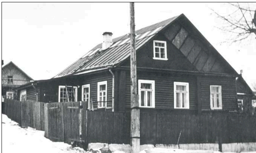
Дом семейства Кооповых в Ивангороде, где работала печатная точка издательства «Христианин»

На каком этапе отключили машину неизвестно. Придётся отмывать.